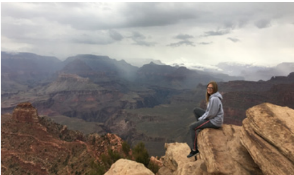
Kelionėje po JAV

Apie ateitį ji kalba atsargiai: „Esu prietaringa ir dažniausiai nepasakoju ką planuoju, o svajoju tyliai. Pasakysiu tiek, kad ateinančioms mokslo metams mano adresas bus JAV, o toliau laikas parodys. Kol kas nenoriu apsisoti vienoje vietoje. Mėgstu išsūkius, ypač savo profesijoje.“