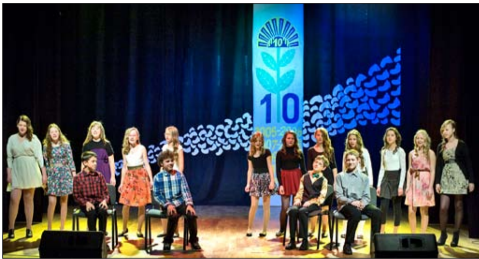
Scenoje muzikinės - literatūrinės kompozicijos dalyviai.

fotoaparatais ir kt. Kasmet panaudojame dalį 2 % paramos: iš šių lėšų įrengta mokinių rūbinė, stendai, nupirktos žaliuzės kabinetų langams, sutvarkytas mokytojų kambarys. Įrengti trys sporto aikštynai, gimnastikos salė, 10 vaizdo stebėjimo kamerų.