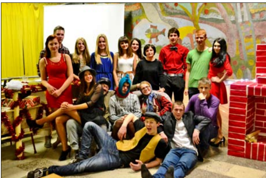
Mes pavargę, bet laimingi.

Neabejotinai, pati sunkiausia užduotis buvo rasti laiko ir po pamokų susirinkti visiems kartu, nes turime ir kitų veiklų: vieni sportuoja, kiti groja, piešia. Dvi prieššventines savaites mokykloje praleisdavome iki vėlamos. Scenarijui kiekvienas turėjome savo idėjų, minčių, kurios dažnai nesutapdavo, tačiau stengėmės ieškoti aukso viduriuko. 5-8 klasių grupei parinkome „Muzikinės kaukės“