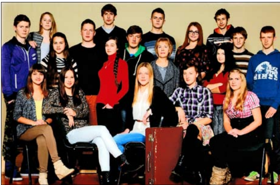
Mes - vienuoliktokai.