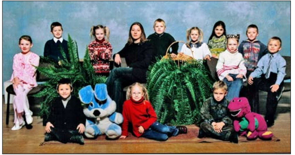
I b klasė 2003 - 2004 m. m.