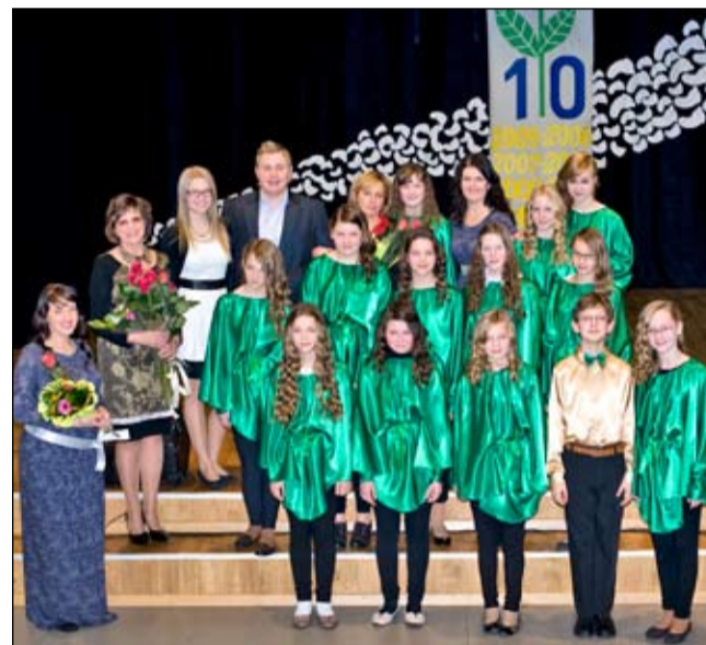
Šventės organizatoriai, vedėjai ir būrelis dalyvių.