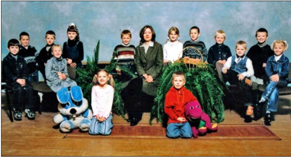
I a klasė 2003- 2004 m. m.