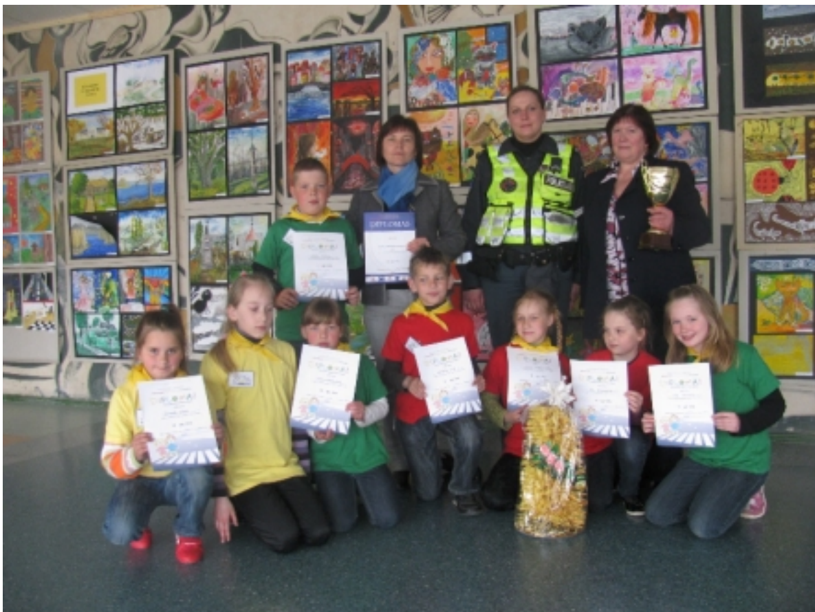
Džiaugsminga akimirka po „Šviesoforo“ varžybų Ignalinoje.

Po atkaklios kovos vėl atsidūrė I vietoje. Tik štai į Prienus jiems vykti neteko. Zarasų švietimo centras sako: „Krizė, niekur nevažiuosit.“ Apmaudu. Tokia žinia ne vienam mokinukui ir ašaras išspaudė.