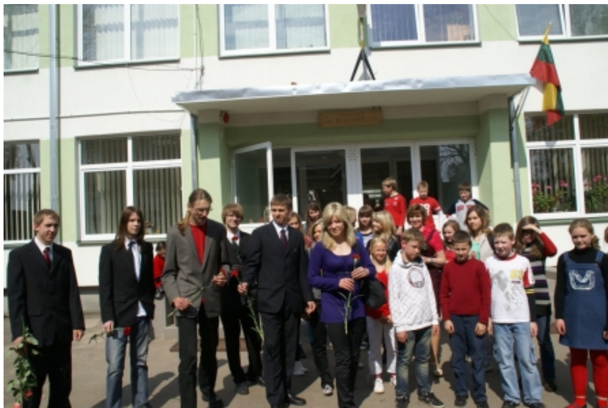
Smagu, kai vieni išsina, o kiti teikia vilčių ateičiai.