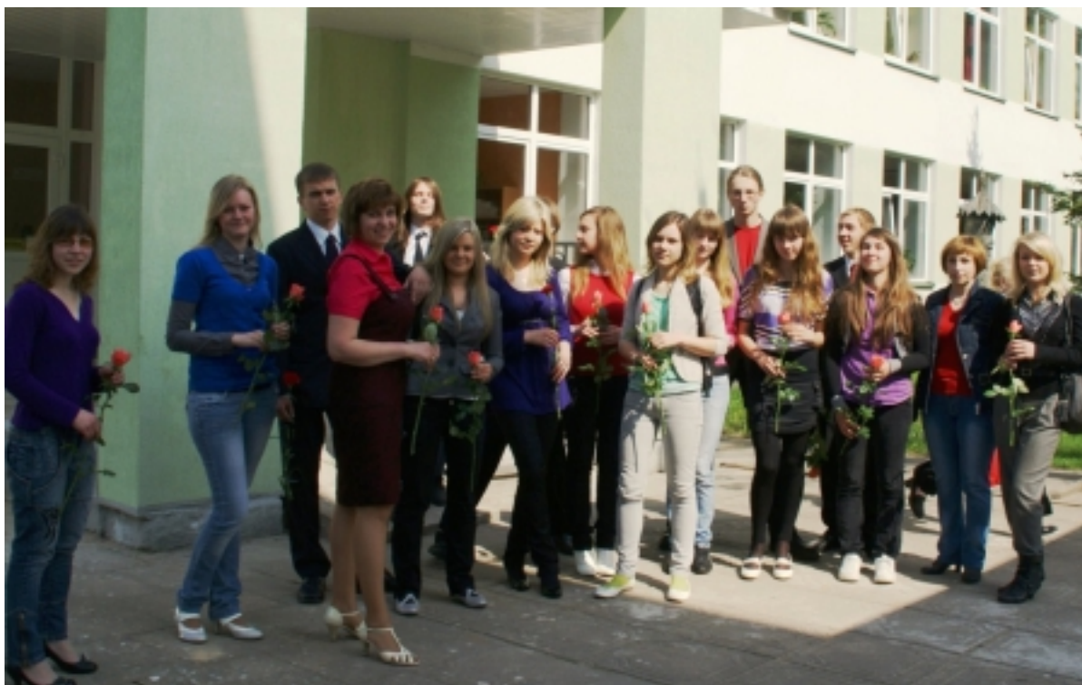
Vis dar netikime, kad reiks palikti mokyklą.