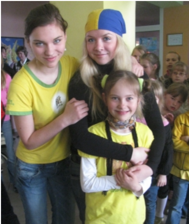
Vyravo geltona spalva.

1-10 klasių mokiniams buvo rodomi filmukai apie mokyklose pasi-