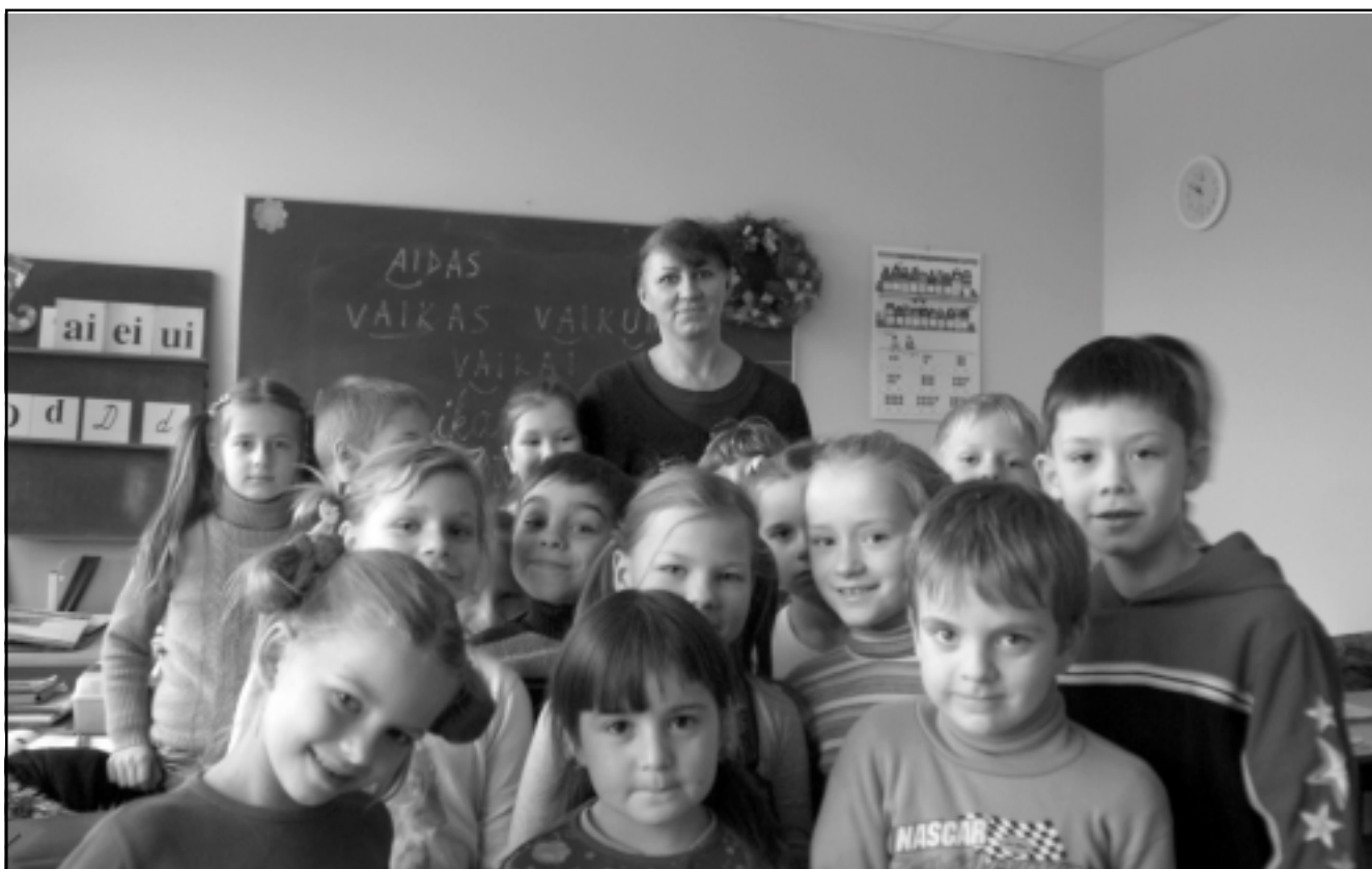
Pirmokėliai su mokytoja.