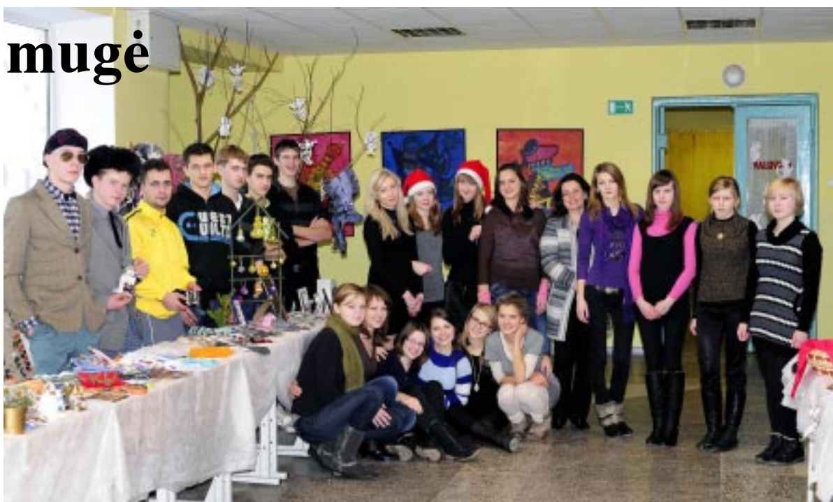
Kalėdinė mugė visiems patiko ir sužadino gerą nuotaiką.

Mugėje stebino ir pačių mažiausiųjų mokinių darbėliai, kuriuos jiems padėjo atlikti tė-