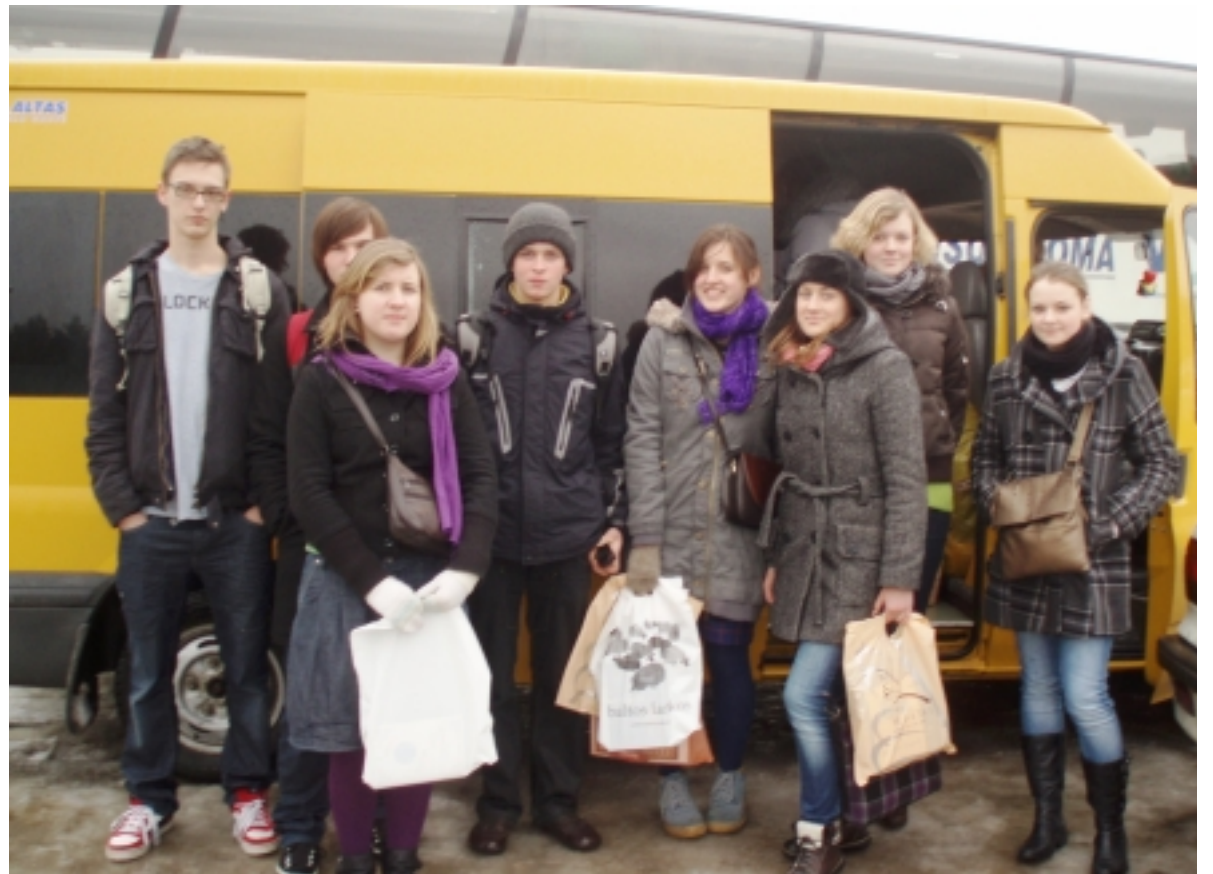
Pirkome gražiausias ir įdomiausias knygas.