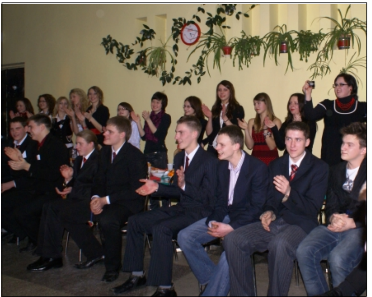
Oi, kaip šmaikštu buvo!

Oficialioji renginio dalis baigėsi, kai nuskambėjo daina