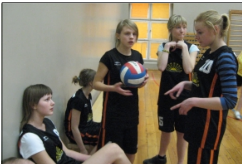
Tinklininkės nusiteikusios kovingai.

8-9 klasių tinklininkai įnirtingai grūmėsi su penkiomis stipriomis komandomis. Pusfi-