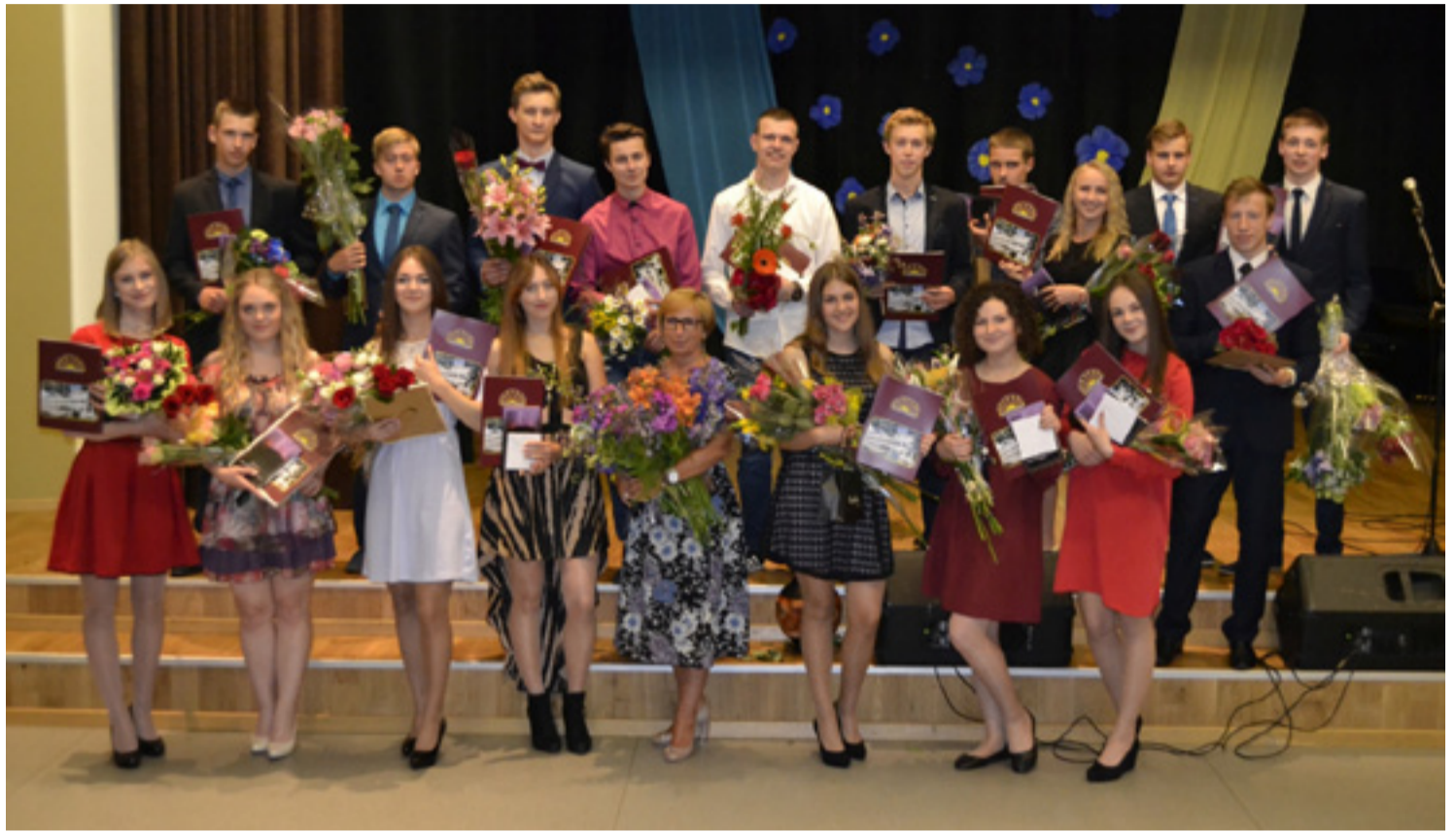
Po atestatų įteikimo.

Įstojau į Greenwich universitetą Londone, studijuojau psichologiją. Mokytis tikrai nėra lengva, nes net ir mokėtus dalykus iš mokyklos kurso, reikia mokytis iš naujo tik – angliškai. Pats sunkiausias dalykas, gyvenant Londone, yra derinti studijas su darbu, nes dažniausiai po universiteto jau nesinori nieko, o dar tenka dirbti. Pats miestas man labai patinka, žmonės taip pat. Labai smagu tai, kad čia labai daug skirtingų ir savai įdomių žmonių. Kaip ir universitete, taip ir apskritai mieste, visi daug labiau atsipalaidavę, drąsesni ir visuomet pasiruošę ištieti pagalbos ranką. Nežinau, gal taip tik atrodo, tačiau daug laimingesni bei draugiškesni nei Lietuvoje. Pati nesigailiu, kad išdrįsau svajones realizuoti viename didžiausių Europos miestų, kiekviena diena pilna naujų iššūkių, tiesa, kartais nelengva atsisakyti komforto zonos, tačiau, jaučiu, kad šis miestas augina bei grūdina mane kaip asmenybę. Visiems dvyliktokams palinkėčiau stengtis ieškoti SAVO tikslo, o ne sekti kitus.