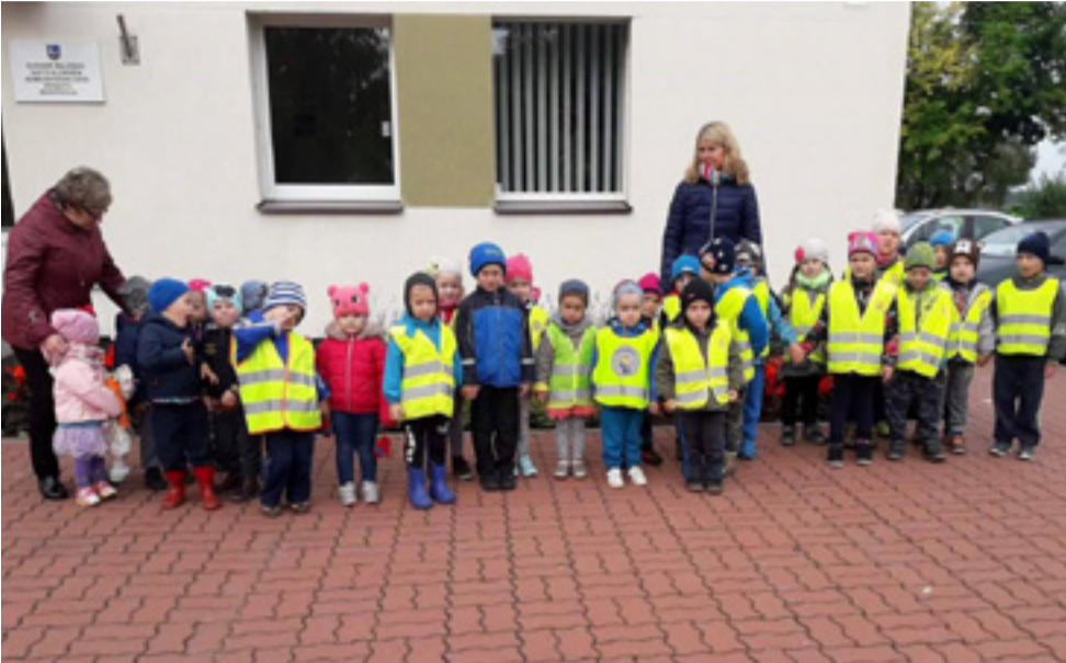
„Pėsčiomis iki seniūnijos“