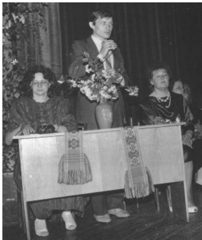
Iškilminga Paskutinio skambučio šventės akimirka.